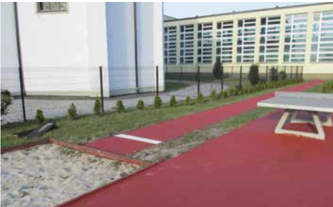
Nowe boisko wielofunkcyjne w Gimnazjum w Bieawie