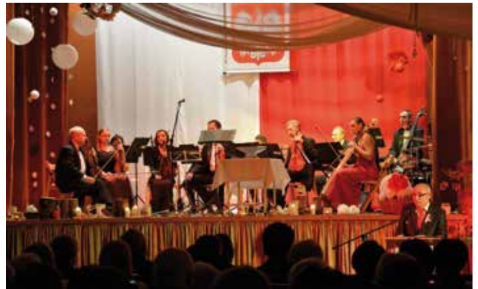
GCKiR - Koncert z okazji Święta 11-go Listopada