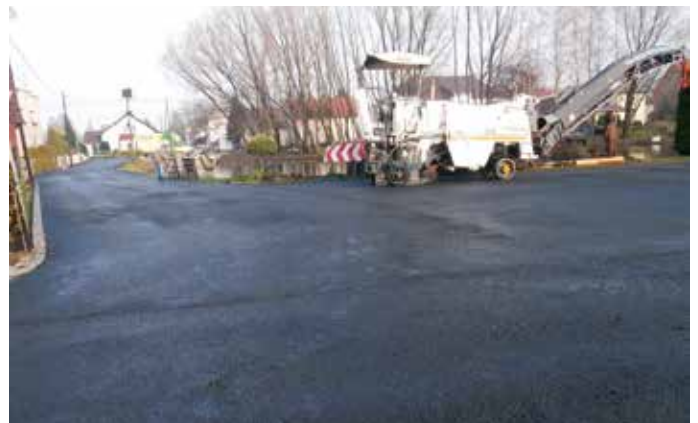
Remont ulicy Wodnej w Dziergowicach