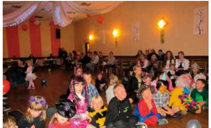
GCKiR - Parada przebierańców