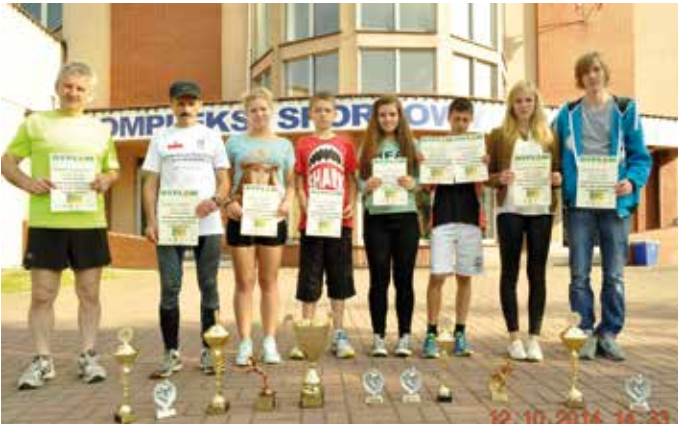
Zawodnicy klubu ZAWISZA STARA KUŹNIA