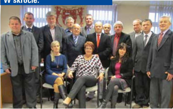
Nowa Rada Gminy Bierawa