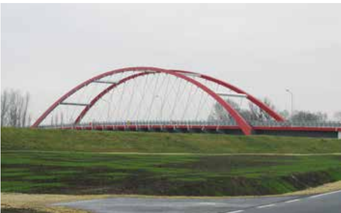
Nowy most Bierawa - Cisek