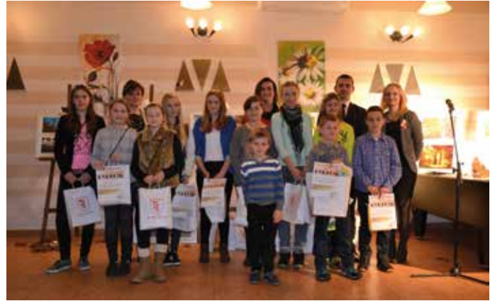
GCKiR - rozstrzygnięcie konkursu fotograficznego