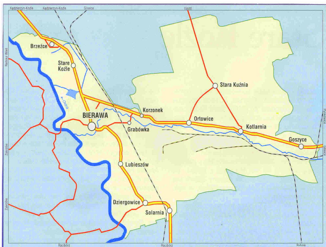
Sołectwo Lubieszów na mapie Gminy Bierawa

Niniejszy plan jest dokumentem otwartym, w związku z tym może być modyfikowany w zależności od potrzeb lokalnej społeczności, finansów, uwarunkowań gospodarczych oraz innych czynników.