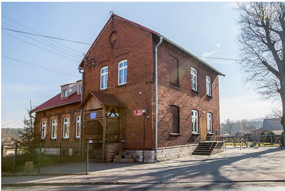
Świetlica wiejska, pomieszczenia TSKNu, oddział przedszkolny – Lubieszów