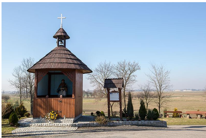
Drewniana kapliczka św. Jana Nepomucena

Na terenie sołectwa znajdują się następujące zabytki: drewniana kapliczka św. Jana Nepomucena z drewnianą figurą tegoż świętego, krzyże przydrożne i kapliczka Najświętszej Marii Panny.