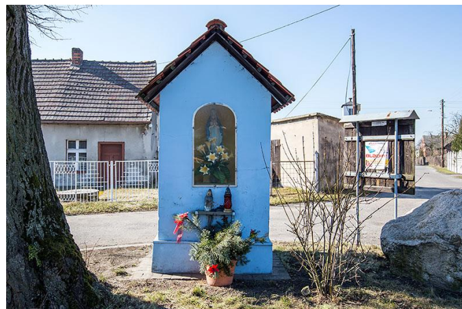
Kapliczka Najświętszej Marii Panny