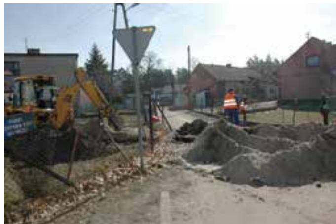
Budowa kanalizacji w Solarni