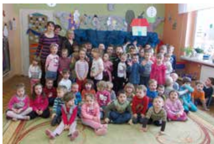
Przedszkole w Dziergowicach - zajęcia z dziećmi