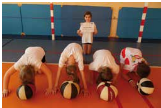
Program PRZYJAZNA SZKOŁA - zajęcia gimnastyczne