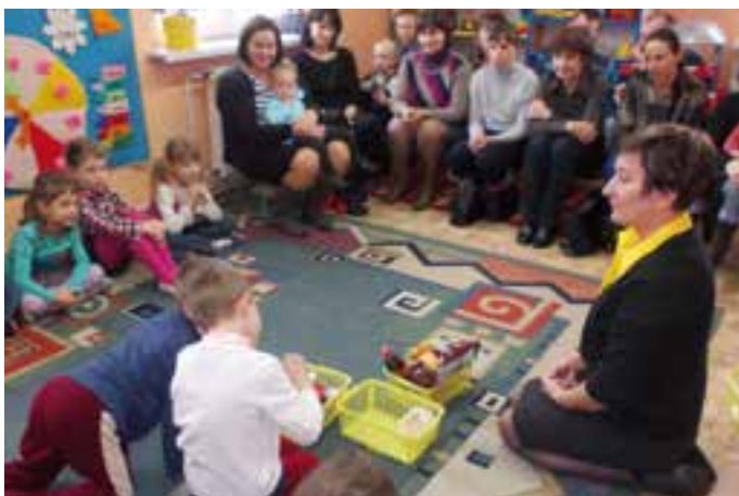
Przedszkole w Dziergowicach - zajęcia z dziećmi