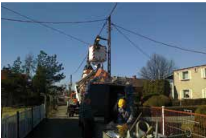
Wymiana lamp w Gminie