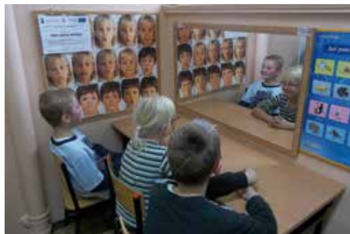
Program PRZYJAZNA SZKOŁA - zajęcia logopedyczne