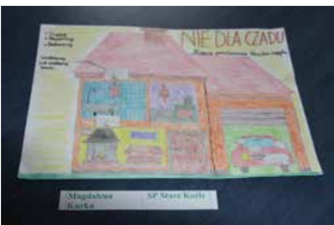
Konkurs plastyczny Zapobiegam pożarom