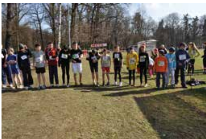
Mistrzostwa Województwa w biegach przełajowych