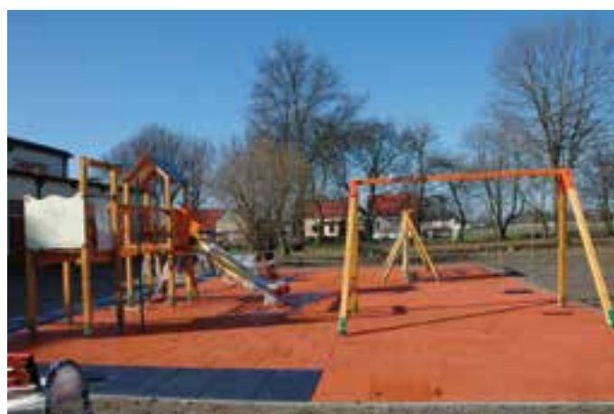
SP Stare Koźle - Plac zabaw