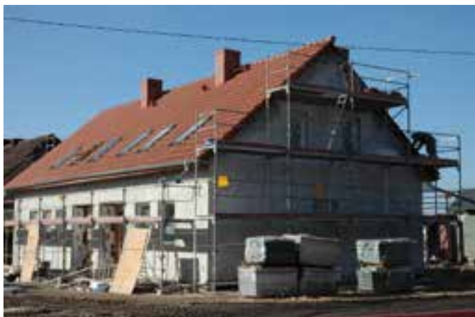
Bierawa - budynek socjalny