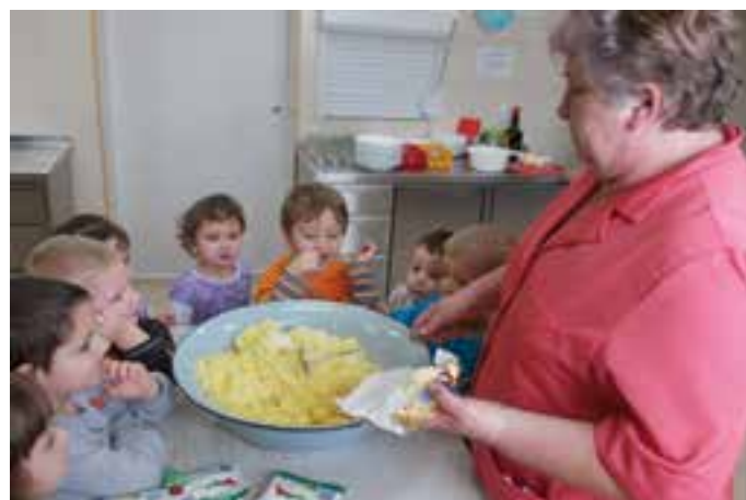
Przedszkole w Dziergowicach - zajęcia z dziećmi