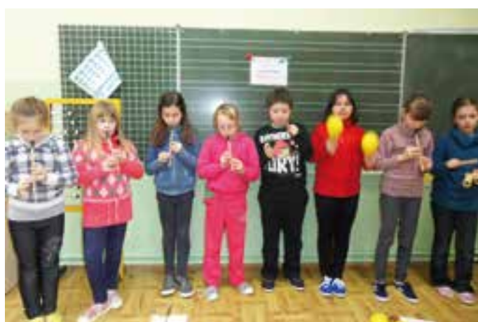
Program PRZYJAZNA SZKOŁA - zajęcia muzyczne