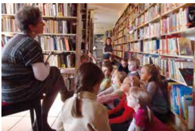
Przedszkole w Bierawie - zajęcia w bibliotece