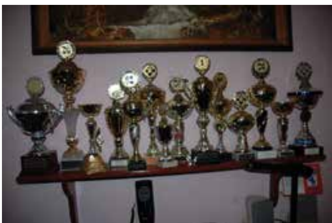
Puchary pasjonata skata - Herberta Pietruszki