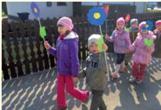
Czyste powietrze wokół nas - Przedszkole w Dziergowicach