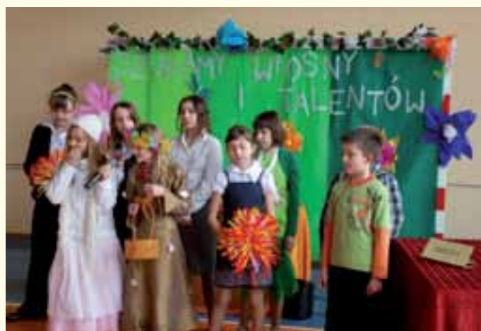
Szkoła Podstawowa w Starym Koźlu - I dzień wiosny.