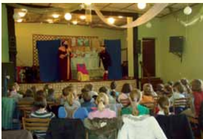
DK w Starej Kuźni - przedstawienie dla dzieci.