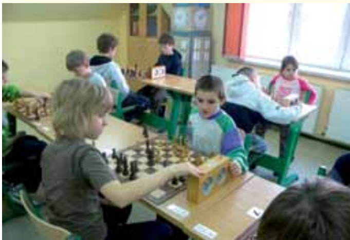
II Szkolny Turniej Szachowy w ZSD w Solarni