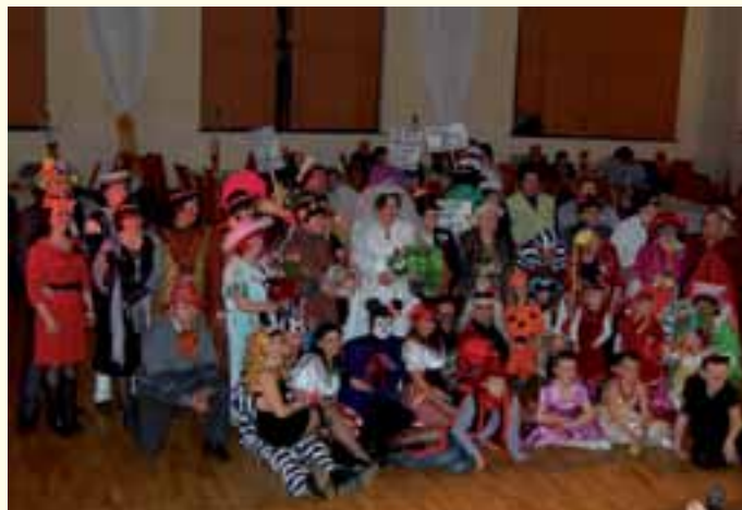
GCKiR - Maskarada.