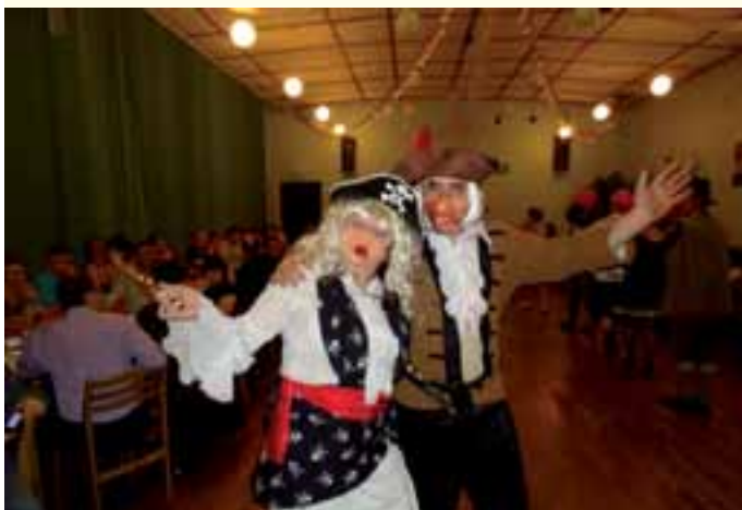
DK w Starej Kuźni - Babski comber.