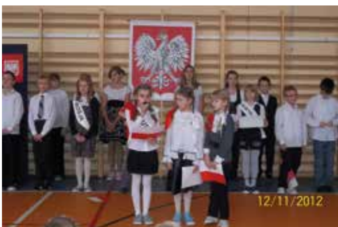
SP Stare Koźle - apel z okazji 11-go Listopada