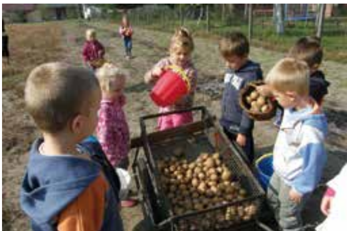
Przedszkole w Lubieszowie - Święto pieczonego ziemniaka