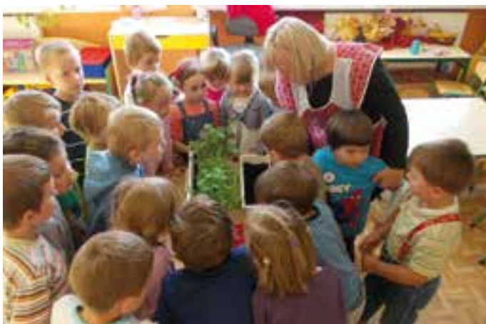
Przedszkole Dziergowice - Zdrowo jemy, zdrowo żyjemy.