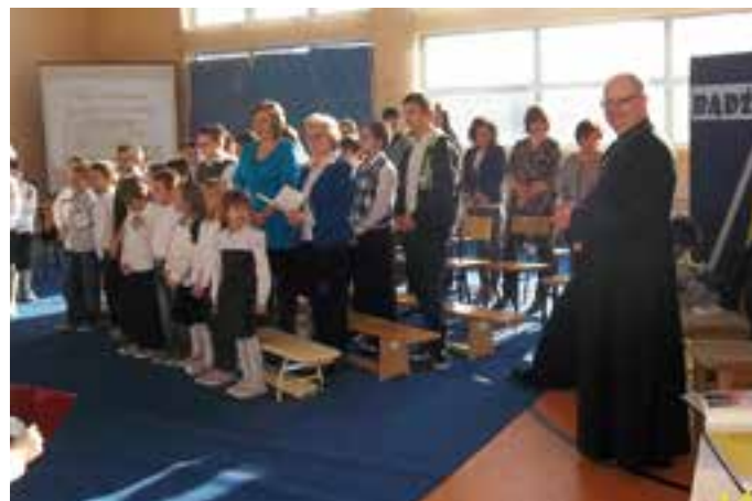
SP Stare Koźle - Wizyta Biskupa