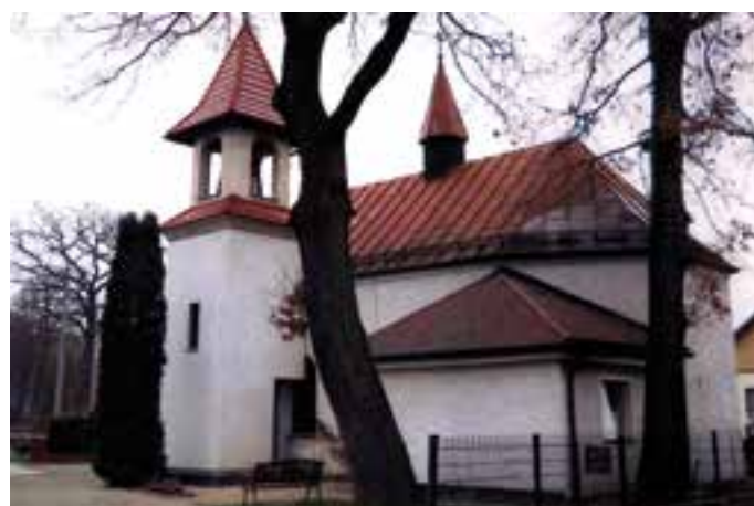
Kościół w Goszycach