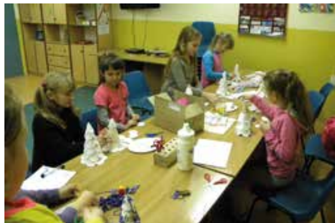
ZSD Solarnia - zajęcia pozalekcyjne